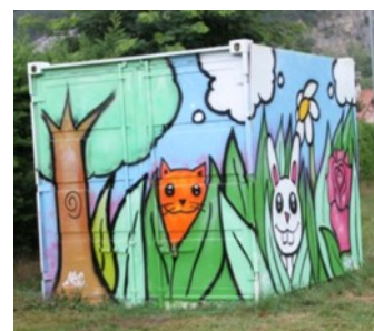
Graff réalisé par les jeunes (août 2017) sur le container aux Jardins Buissonniers

Graff sur les anciens vestiaires du foot.